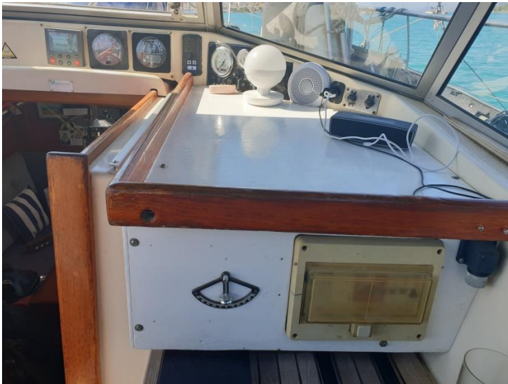
Anschluss für Außenstrom,

Stromnetz und Spannungswandler. Der Baby-funk re wurde 2024 ausgetauscht.