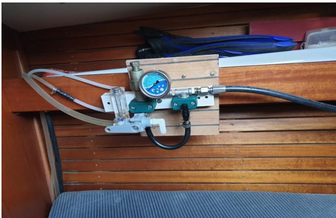
Wassermacher im Vorschiff