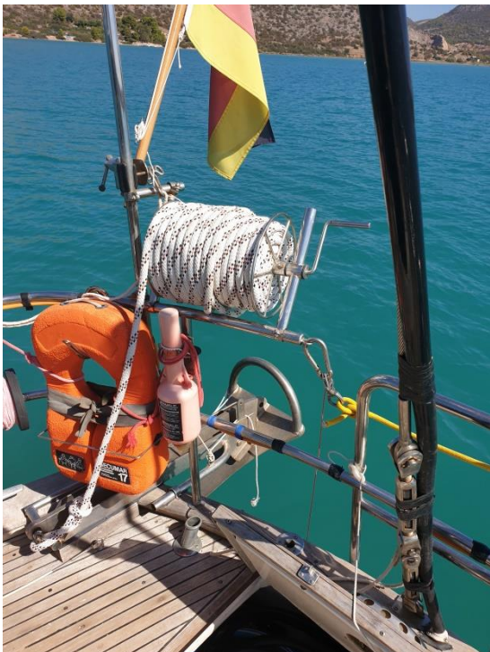
Landfeste auf Trommel. Rettungskragen mit Rapprolle (nicht zu sehen) und Blitzlicht.