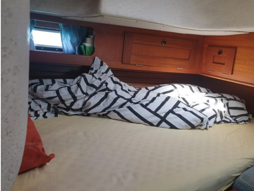
matratz Mit Bettauflage und Spannbettbezug