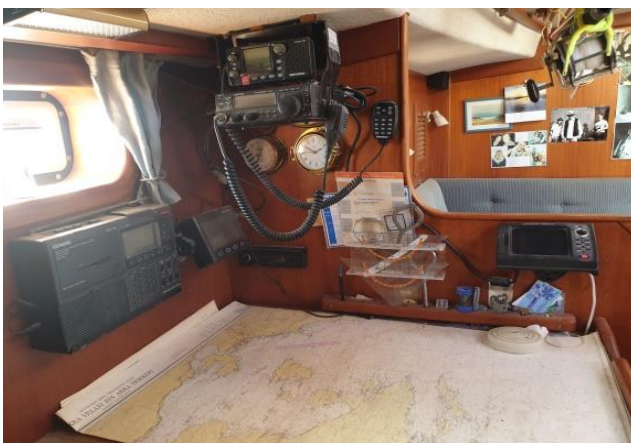
Kartentisch und rechts oben Durchblick in den Salon

Sony Welt-Empfänger ganz li UKW Funk Kurzwellen Sender-/empfänger (mit Vorverstärker und isolierter Achterstag- antenne) Plotter ganz re Alle Geräte (außer Kurzwelle und Sony Weltempf.wurden 2023/24 durch neue ersetzt , vgl Liste oben