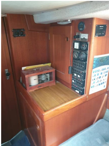
Sicherungen und Anzeigen, Barometer. Paneele für Webastoheizung, Bilgepumpe etc.