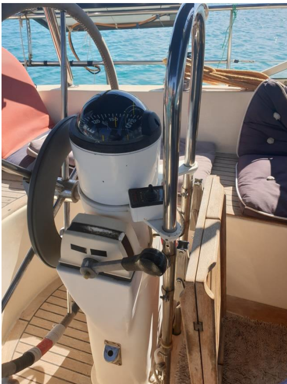
Steuersäule mit Ruderautomat