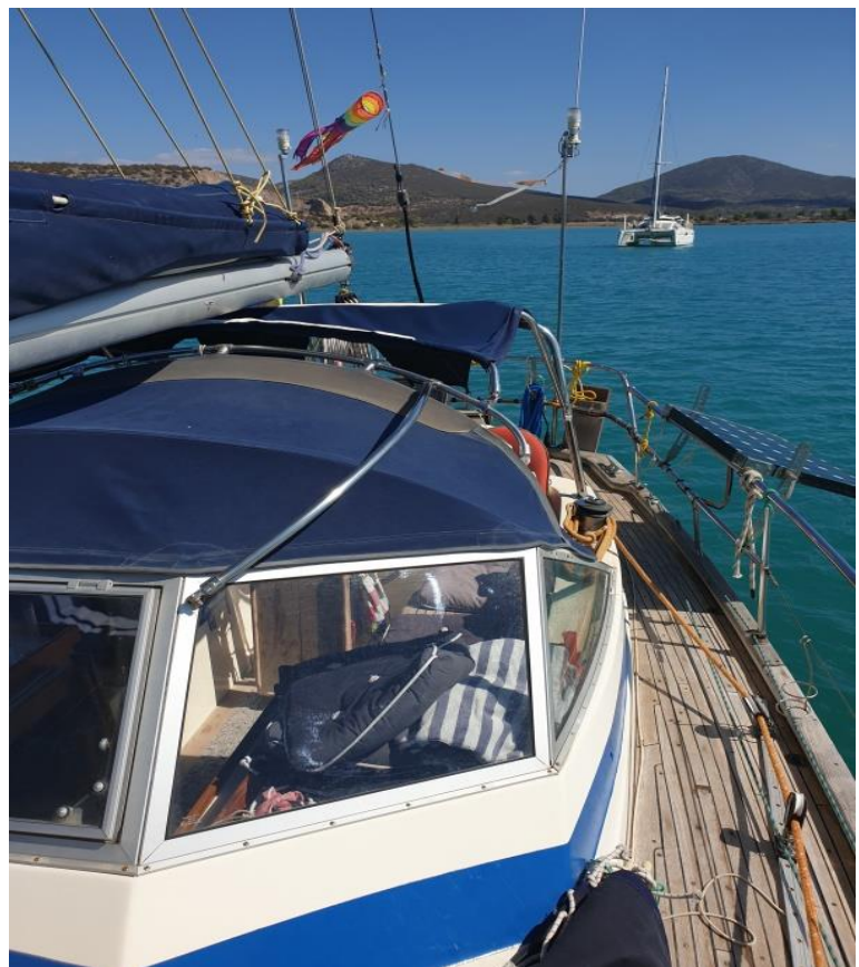
Haltebügel an der Sprayhood