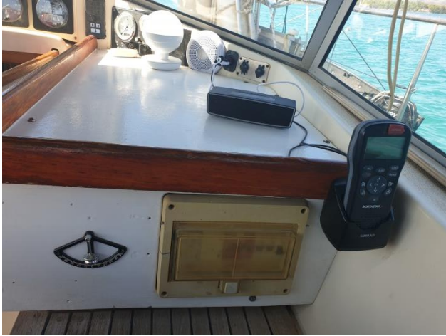
Sicherungskasten für 220 Volt

Stromnetz und Spannungswandler. Der Baby-funk re wurde 2024 ausgetauscht.