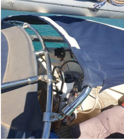
Bimini mit Durchblick vom Cockpit aus zum Masttop-Verklicker