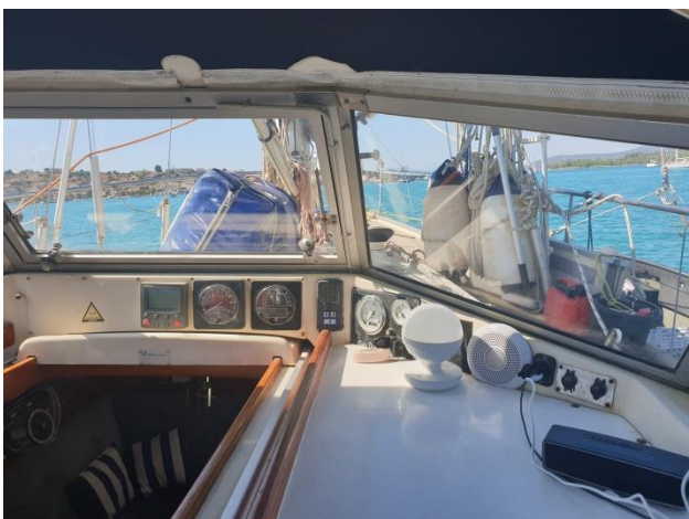
Armaturen mit diversen Steckern zum Handy-Aufladen.