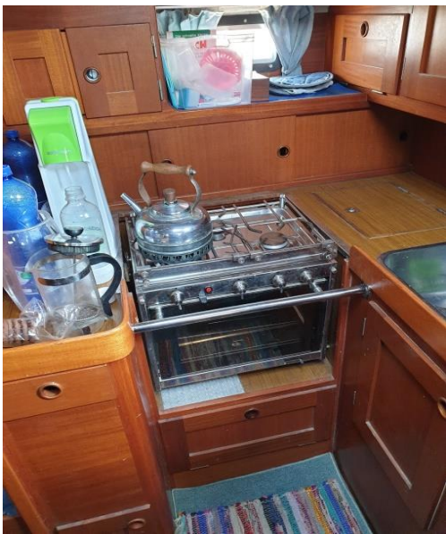
Küche mit Gasherd und Backofen