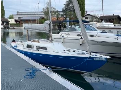
Boot segelfertig April 2024