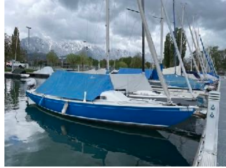
Boot mit Sommerpersenning