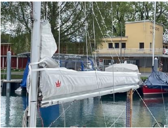
Grossegel mit ZipPack/Lazy Jacks von Elvström Sails