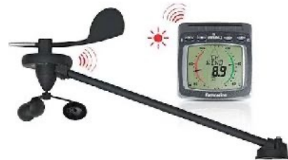
Kabellose solarbetriebene Windmessanlage von Raymarine®